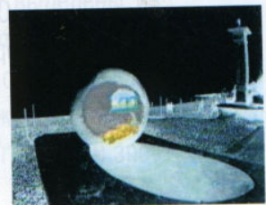
ФОТО И ВИДЕО. АПРЕЛЬ 1998г. Киев